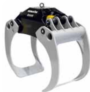
Heavy duty -koura erittäin lujasta kulutusteräksestä valmistetuilla leuoilla