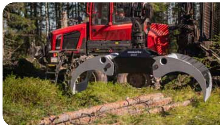
Tuottava rakenne suurella avautumalla