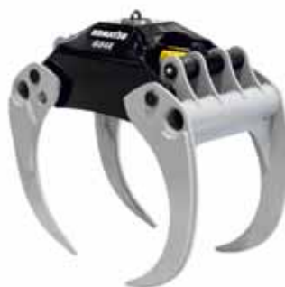
E-luokka, energiajakeen käsittelyyn